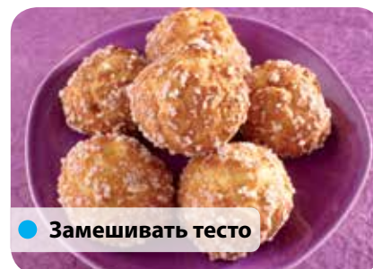
● ● Замешивать тесто