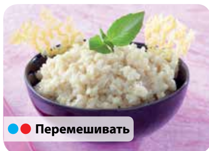
● ● Перемешивать