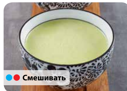
● ● Смешивать