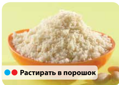
● ● Растирать в порошок