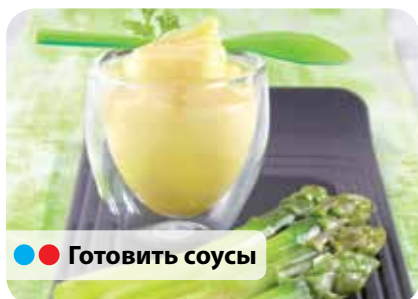
● ● Готовить соусы